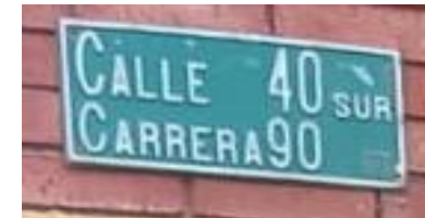
PLACA DE NOMENCLATURA